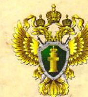
ПРОКУРАТУРА ГОРОДА САМАРЫ